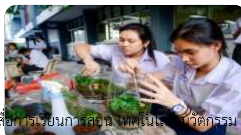
๒.๗ สนับสนุนการผลิต จัดทำ และใช้สื่อการเรียนการสอน เทคโนโลยี นวัตกรรม